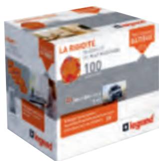
0 801 15