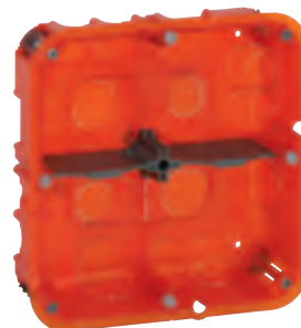
0 801 24